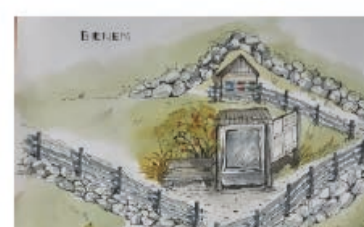
Station: Bienen und Wildbienen